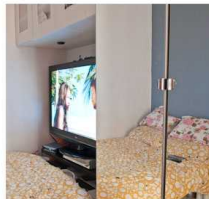
Ca fait quatre fois qu'on refait la chambre. Je veux pas me réveiller et avoir l'impression qu'on dort dehors. On fait des efforts, mais parfois on baisse les bras.

Hortense Soichet, Série Habiter la Goutte d'Or , 2009-2010 Photographies sur Dibond, dyptique, 30 x 40 cm