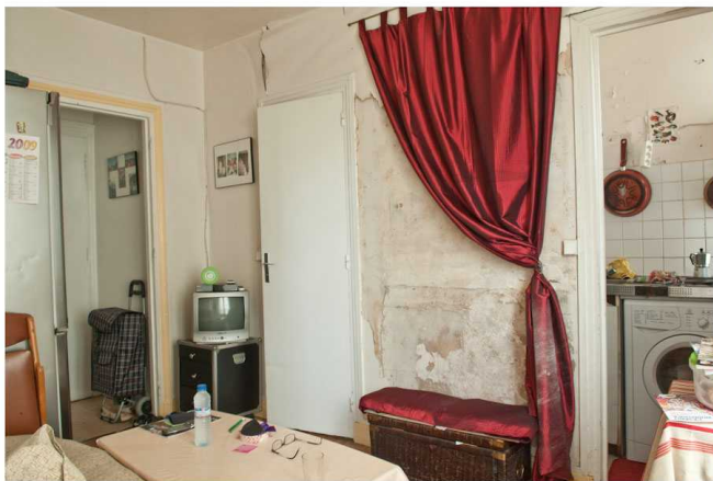
rue Myrha, 3 habitants, 2 pièces, 28 m 2 , 2005.